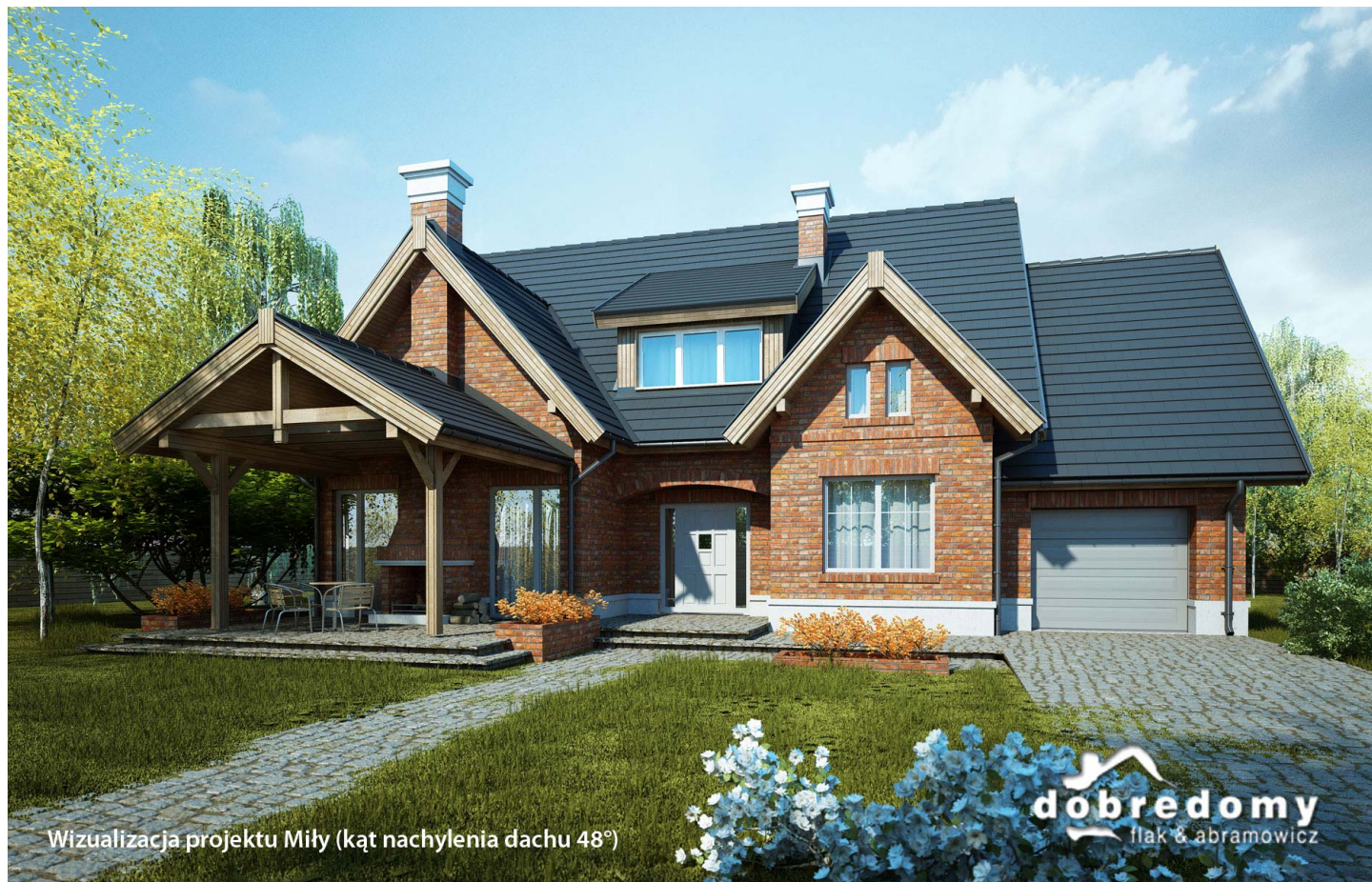
Wizualizacja projektu Miły (kąt nachylenia dachu 48°)

autor: Iwona Flak Tomasz Flak cena projektu: 4 980 zł