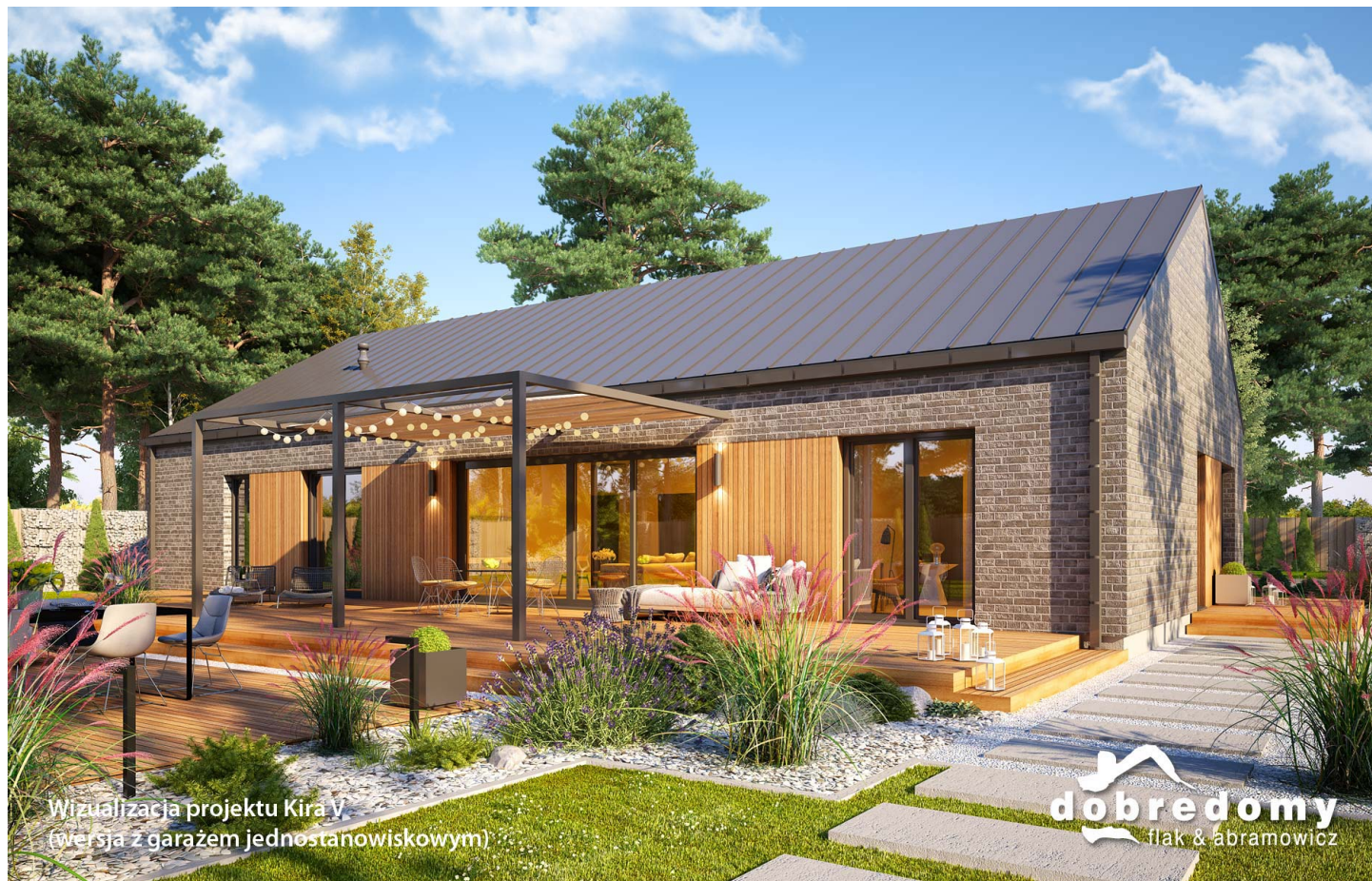
Wizualizacja projektu Kira V (wersja z garażem jedno-stanowiskowym)

autor: Tomasz Flak Katarzyna Płaczek cena projektu: 5 070 zł