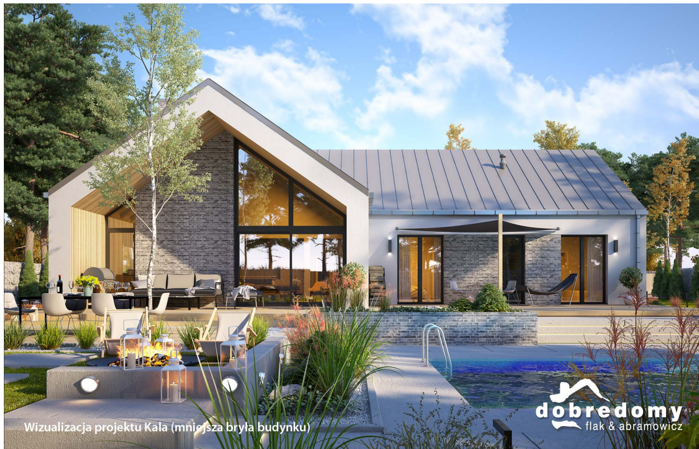
Wizualizacja projektu Kala (mniejsza bryła budynku)

autor: Tomasz Flak Katarzyna Płaczek cena projektu: 5 120 zł