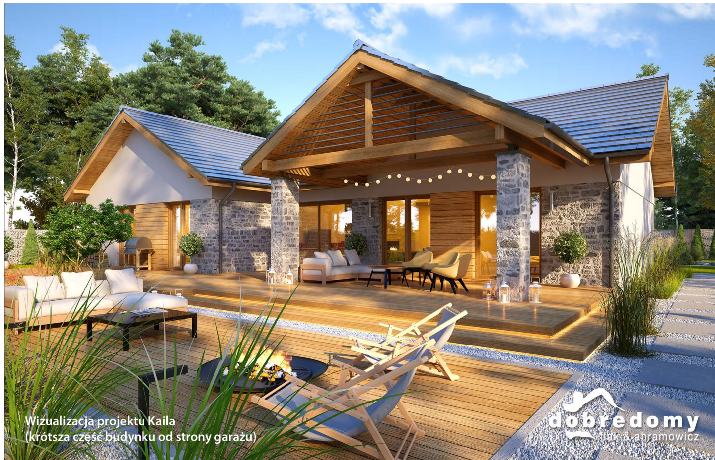
Wizualizacja projektu Kaila (krótsza część budynku od strony garażu)

autor: Tomasz Flak Katarzyna Płaczek cena projektu: 5 230 zł