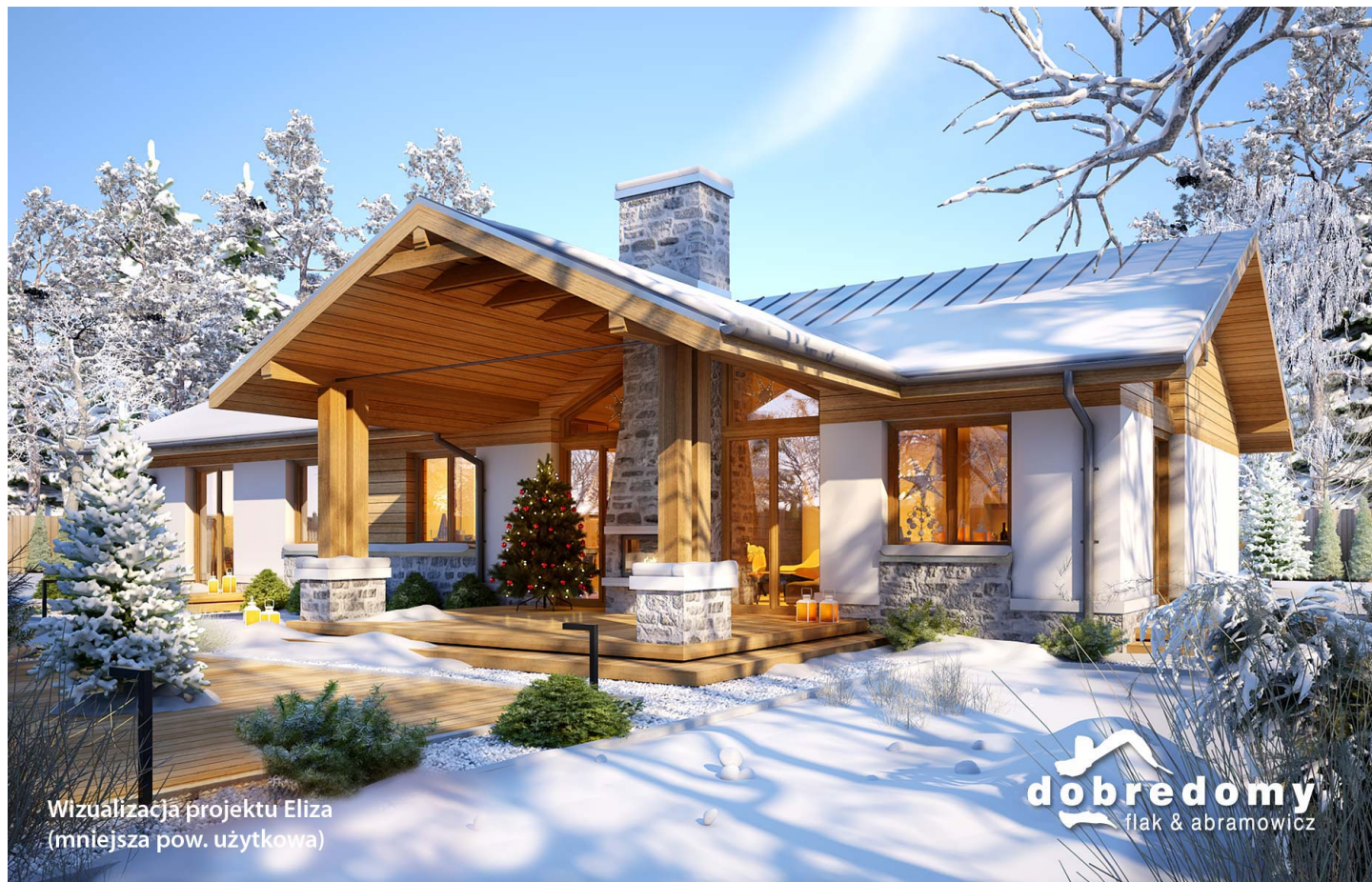
Wizualizacja projektu Eliza (mniejsza pow. użytkowa)

autor: Marta Zaperty-Adamek Marcin Abramowicz cena projektu: 4 990 zł