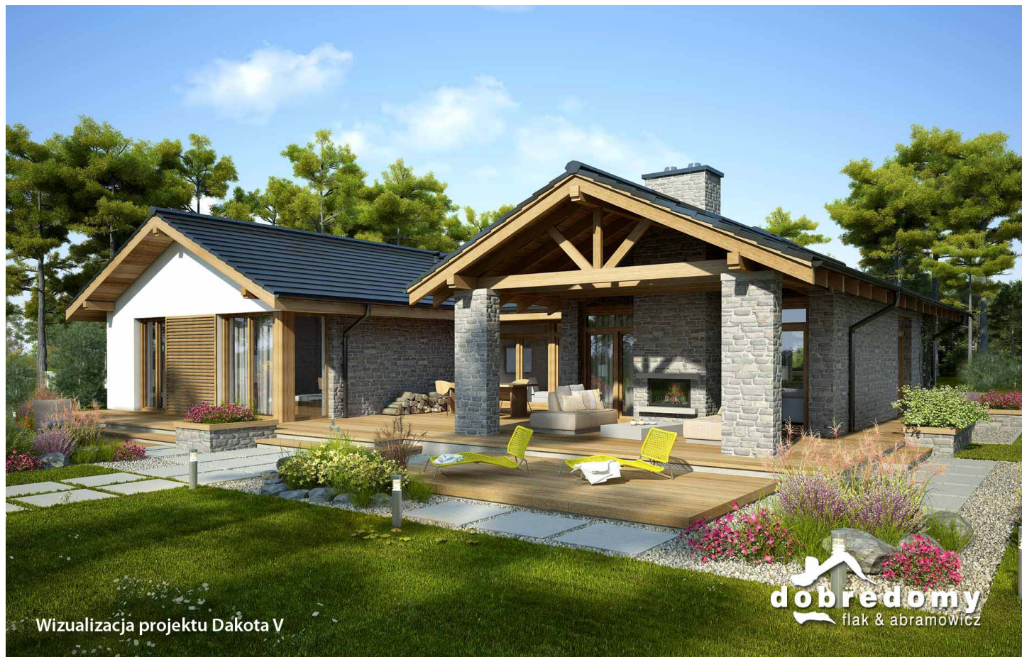
Wizualizacja projektu Dakota V

autor: Marcin Abramowicz Marta Zaperty-Adamek cena projektu: 6 190 zł