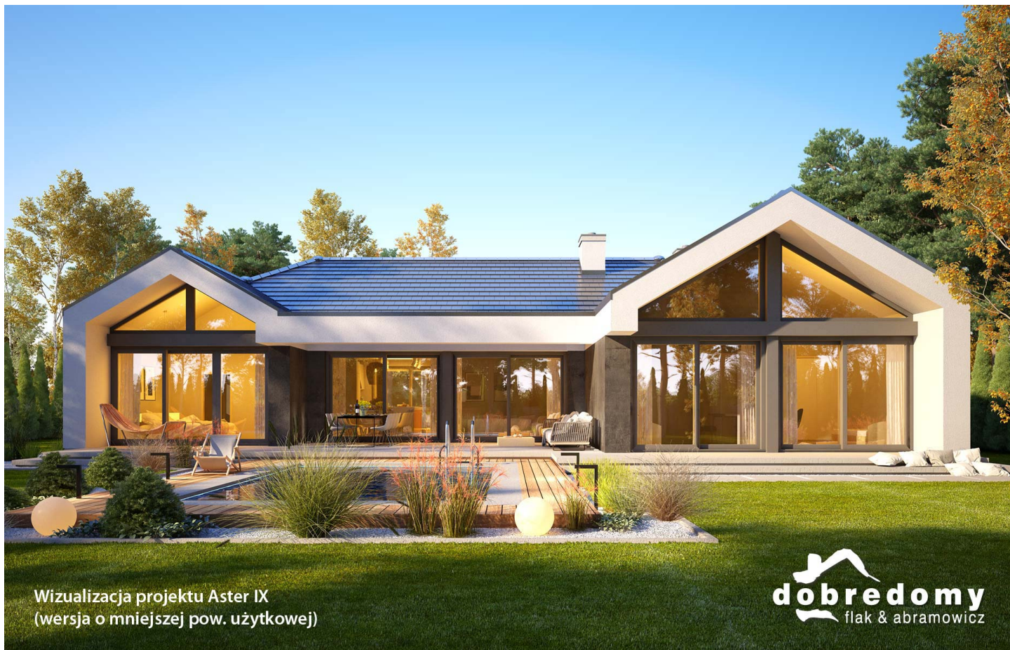
Wizualizacja projektu Aster IX (wersja o mniejszej pow. użytkowej)

autor: Marcin Abramowicz Marta Zaperty-Adamek cena projektu: 5 990 zł