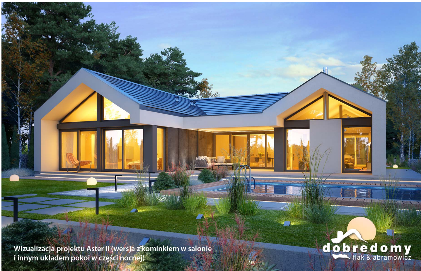
Wizualizacja projektu Aster II (wersja z kominkiem w salonie i innym układem pokoi w części nocnej)

autor: Marcin Abramowicz Marta Zaperty-Adamek cena projektu: 6 290 zł