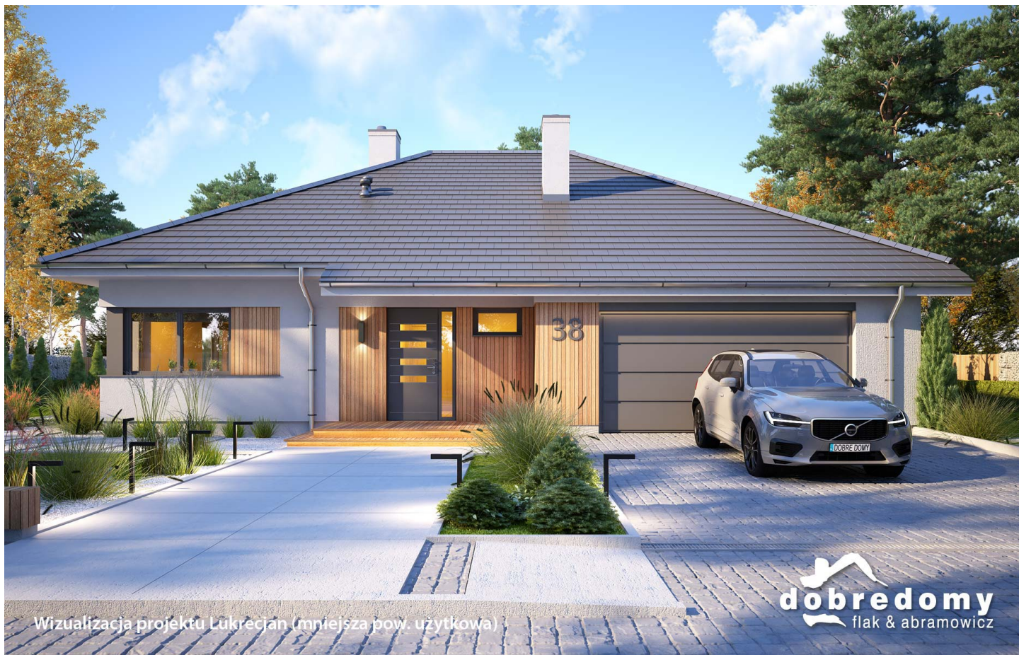
Wizualizacja projektu Lukrecjan (mniejsza pow. użytkowa)

autor: Marcin Abramowicz Marta Zaperty-Adamek cena projektu: 4 750 zł