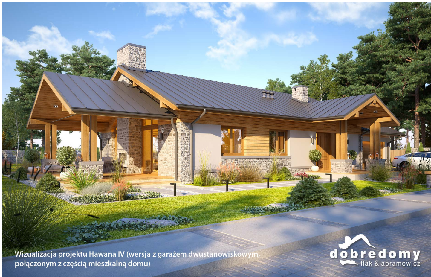
Wizualizacja projektu Hawana IV (wersja z garażem dwustanowiskowym, połączonym z częścią mieszkalną domu)

autor: Marcin Abramowicz Jagoda Gruca cena projektu: 4 710 zł