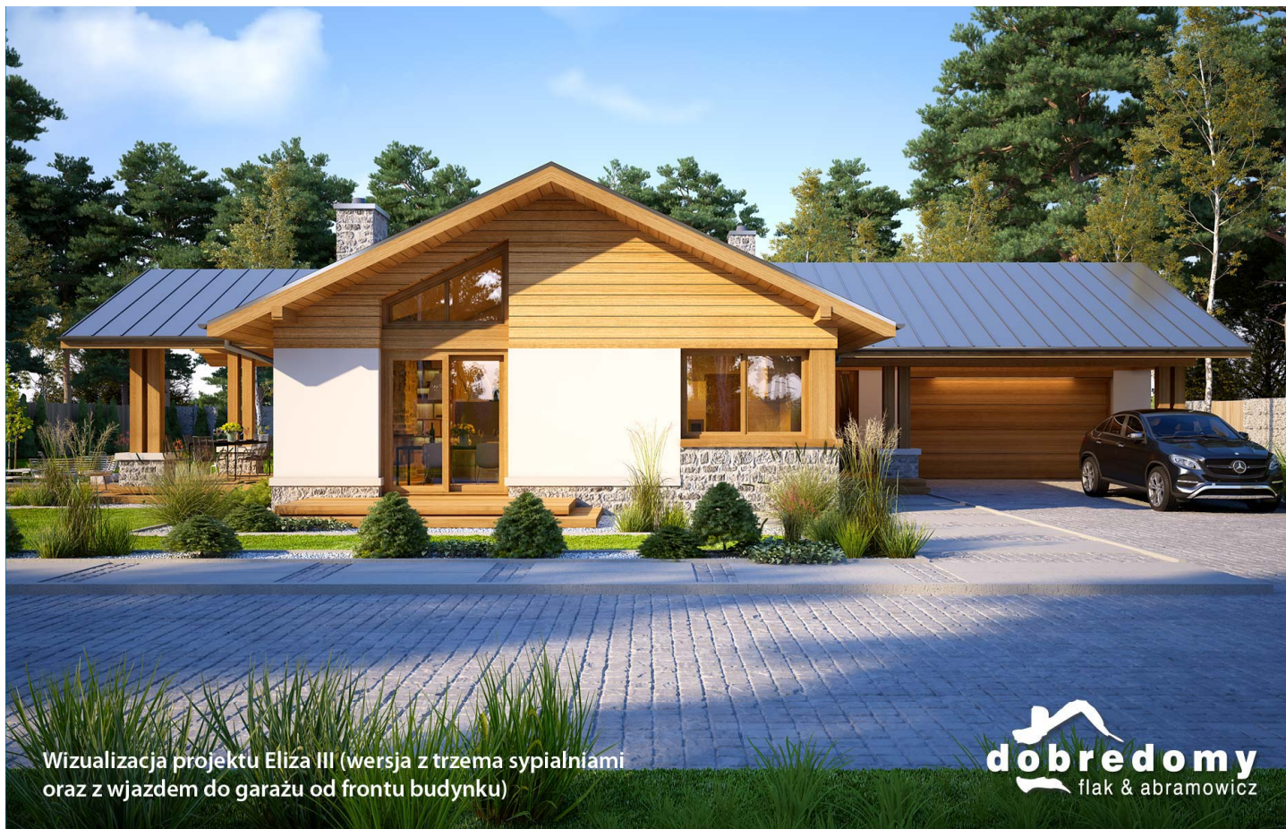
Wizualizacja projektu Eliza III (wersja z trzema sypialniami oraz z wjazdem do garażu od frontu budynku)

autor: Marta Zaperty-Adamek Marcin Abramowicz cena projektu: 4 790 zł