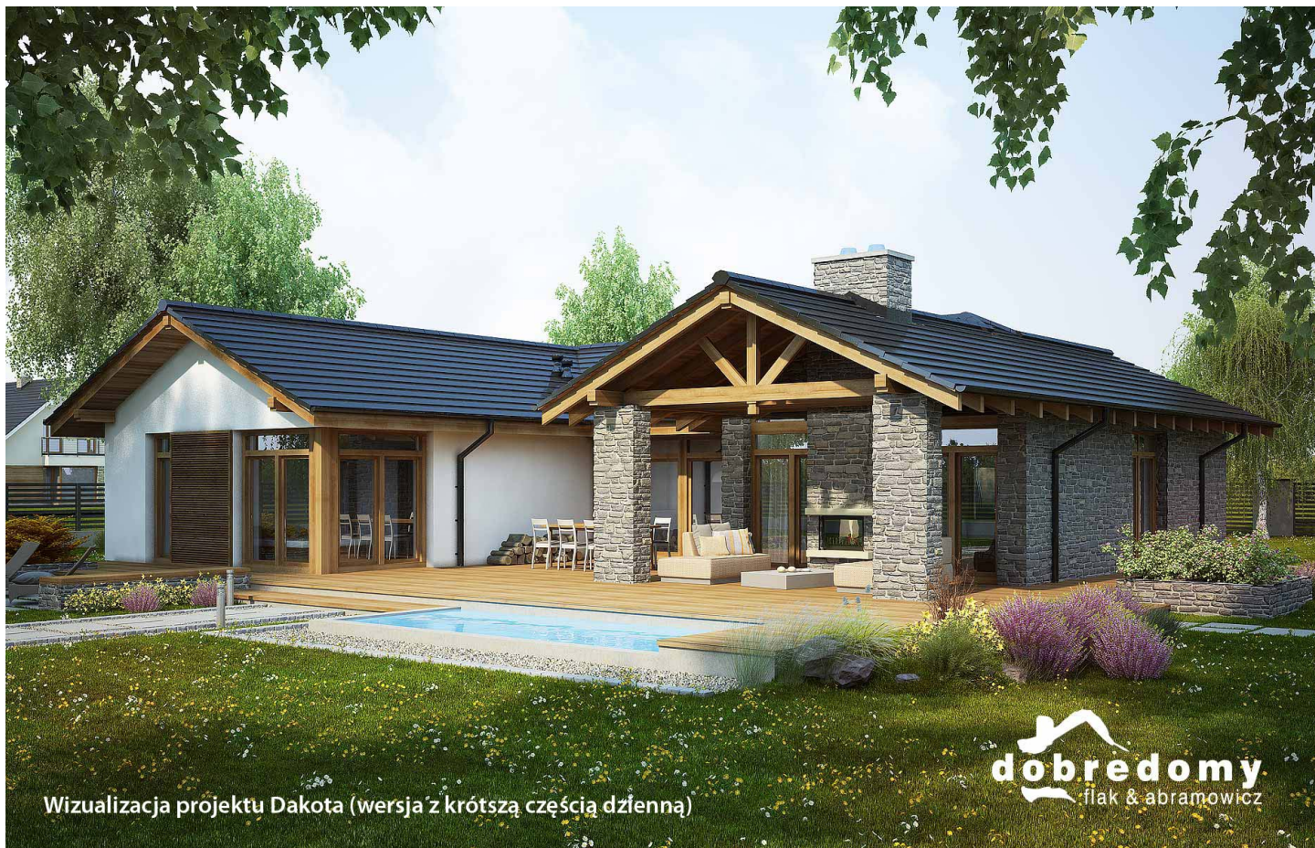
Wizualizacja projektu Dakota (wersja z krótszą częścią dzienną)

autor: Marcin Abramowicz Marta Zaperty-Adamek cena projektu: 5 290 zł