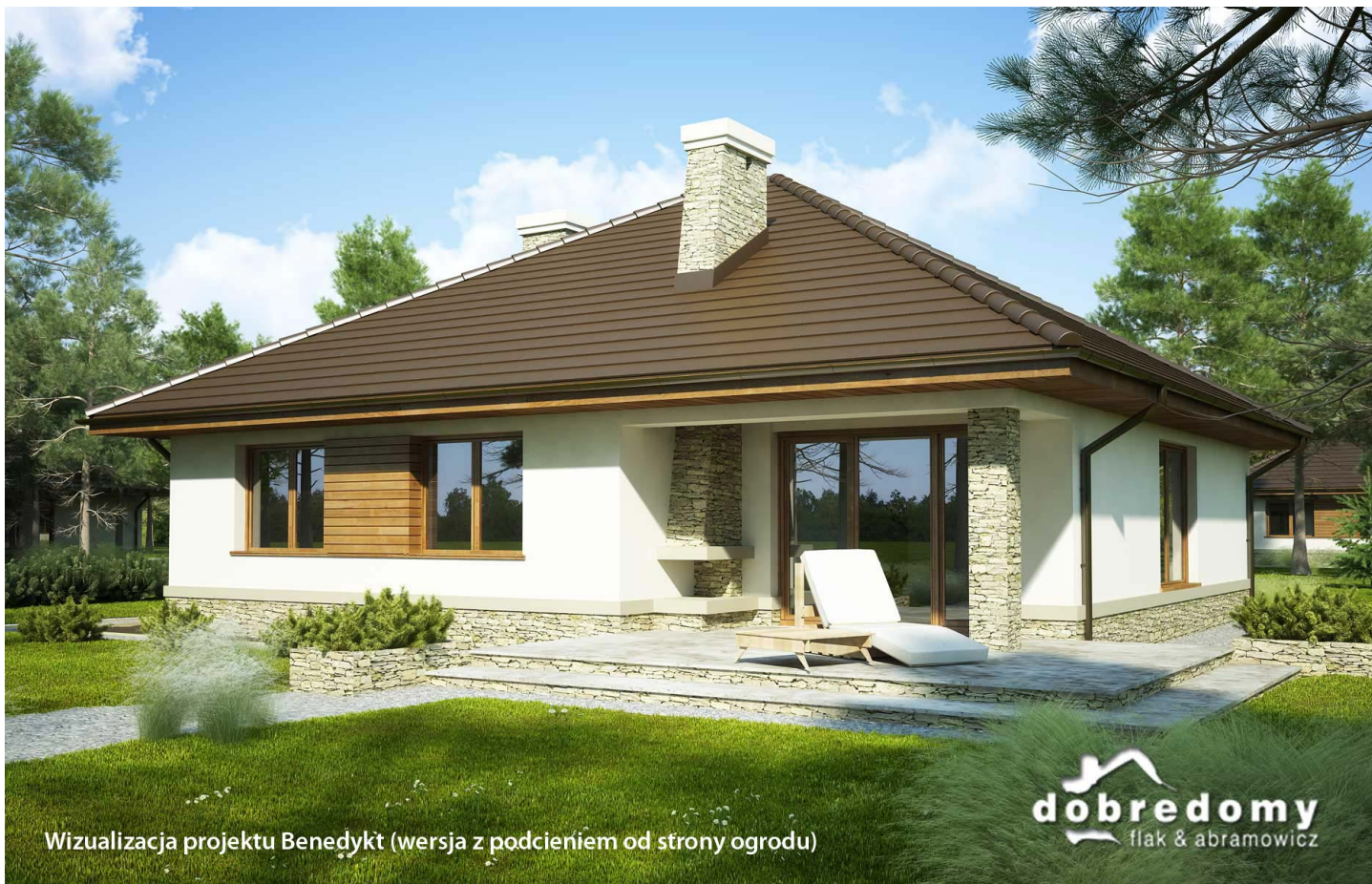
Wizualizacja projektu Benedykt (wersja z podcieniem od strony ogrodu)

autor: Marcin Abramowicz Marta Zaperty-Adamek cena projektu: 4 090 zł